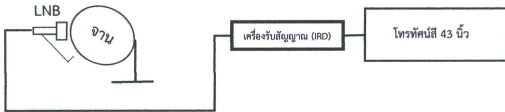
ภาพประกอบการติดตั้งจานดาวเทียม กลุ่มที่ 1

5.1.7 ต้องเดินสายไฟฟ้าชนิด VAF 1.5 SQ.mm. ตามมาตรฐานที่การไฟฟ้ากำหนด ที่มีเต้ารับไม่น้อยกว่า 2 ช่อง สำหรับ Smart TV และเครื่องรับสัญญาณภาพดาวเทียม (IRD)